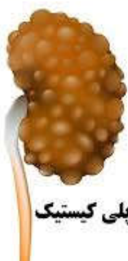
کلیه پلی کیستیک