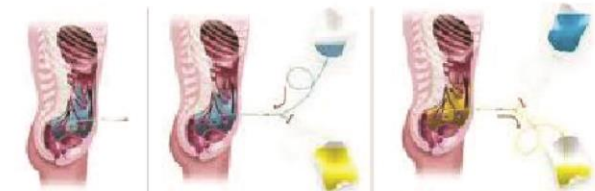
۱- خروج مایع از شکم ۲- پر شدن صفاق از محلول دیالیز ۳- اتمام دیالیز

رفته و پس از مدتی سموم خون از صافی نیمه تراوای صفاقی به کیسه جمع‌کننده محلول خارج شونده از صفاق دفع می‌شود. در حالی که گلوکوز، لاکتات و در مقیاس کمتر کلسیم، در مسیری معکوس از محلول واردشونده دیالیز وارد صفاق و از آنجا وارد جریان خون می‌شوند.