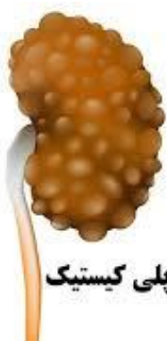
کلیه پلی کیستیک